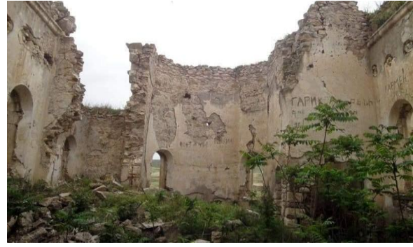
Остатки якобы разрушенного Православного храма (Ходжавенд) .