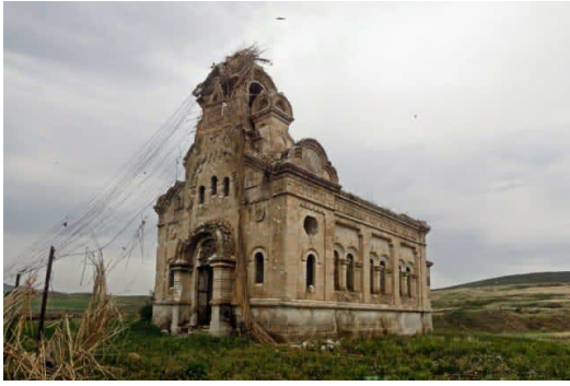
Якобы разрушенный Православный храм (Ходжавенд) .