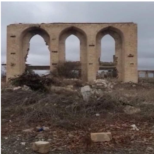
Развалины якобы разрушенного Драмтеатра в городе Агдам.