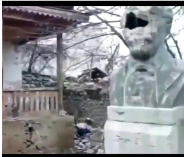
Памятник Народному артисту СССР Бюль-Бюлю в его доме-музее в Шуше, якобы расстрелянный из стрелкового оружия .

И это лишь малая толика того, что было якобы разрушено оккупантами. А еще – якобы более семисот памятников истории и культуры, и якобы храмы Гянджасар, Кельбаджарский район, XIII век и мавзолеев в селе Хачин-Турбатлы, Агдамский район, XIV век. И якобы полуразрушенные вандалами Худаферинские мосты VII–XII веков. И якобы немалое число зданий современной постройки – Дворцов культуры, музыкальных школ, музеев, библиотек и жилых домов. Город Агдам якобы был стерт с лица земли, а в городе Физули после изгнания из него оккупантов якобы не осталось ни одного уцелевшего здания, на котором можно было бы вывесить флаг Азербайджана.